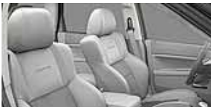
Medium Slate Gray