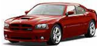
Inferno Red Crystal Pearlcoat