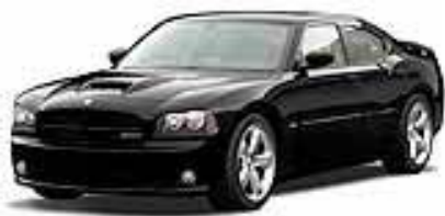
Brilliant Black Crystal Pearlcoat