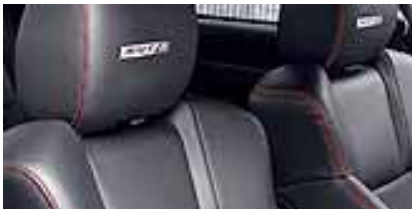
Dark Slate Gray Royale