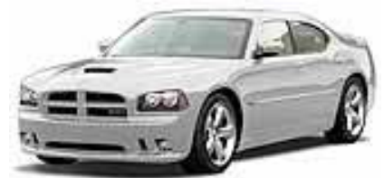
Bright Silver met.