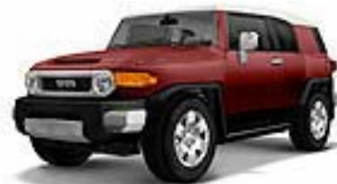
Black Cherry Pearl